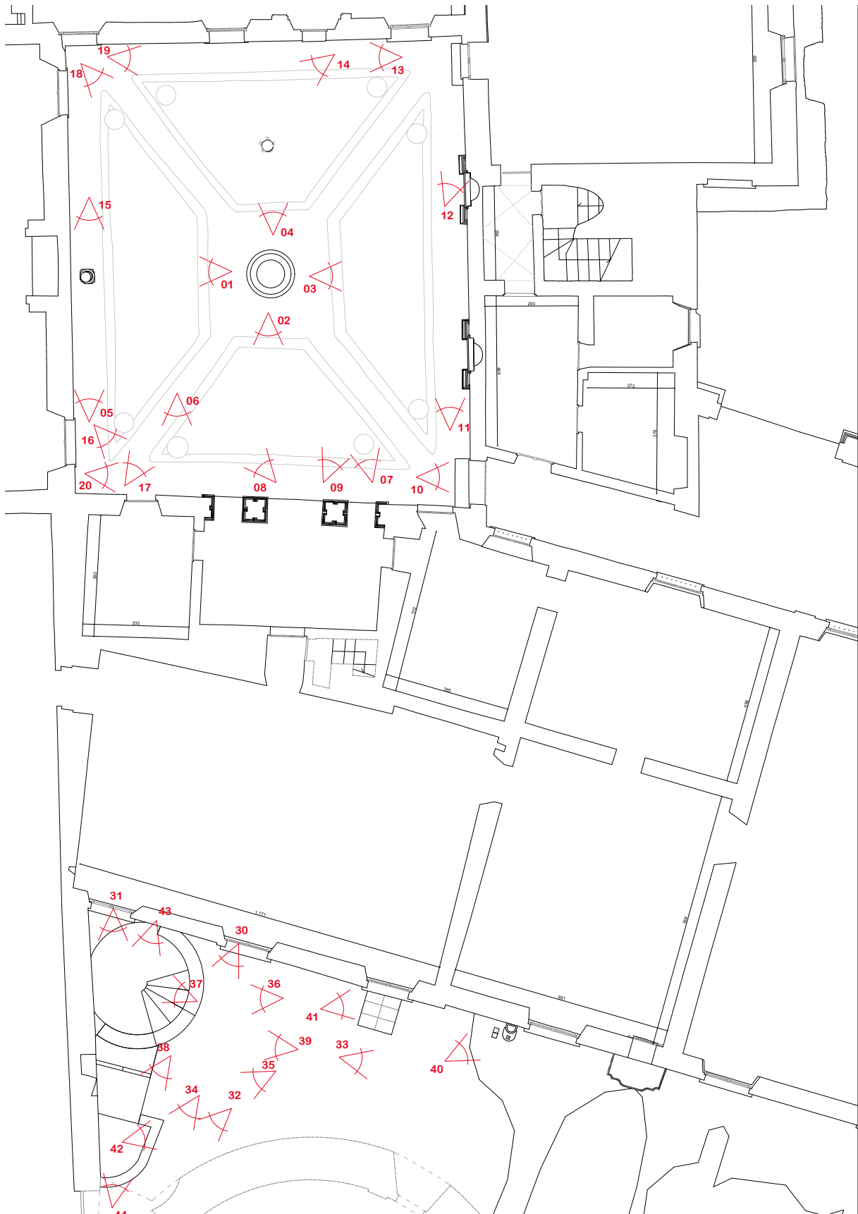
Pianta piano primo